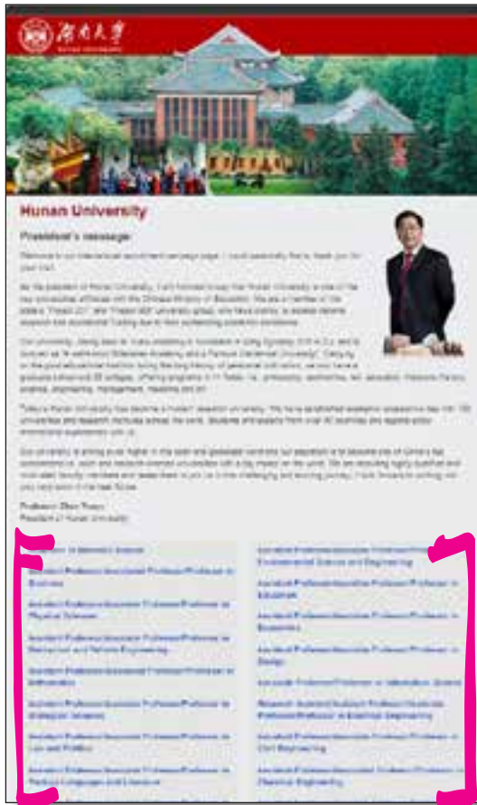
链接页面将湖南大学在不同学术目录下发布的招聘信息集中在一个页面上予以展示